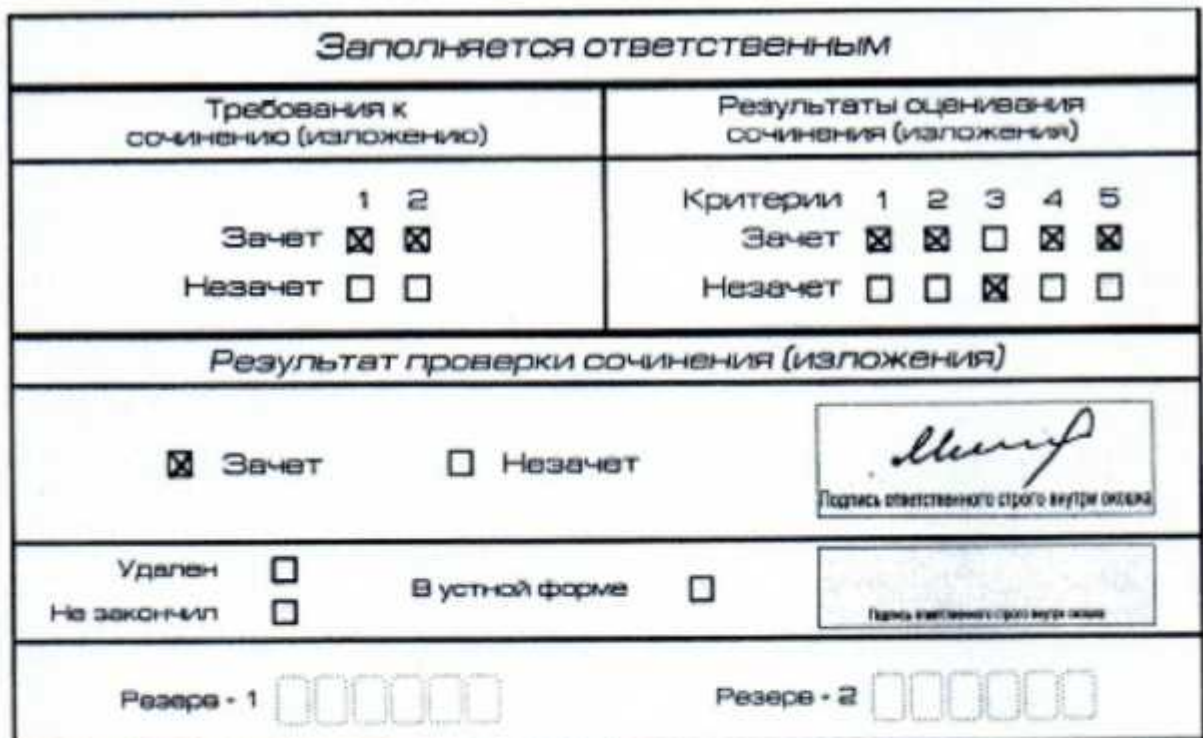
Рис. 11. Область для оценки работы

После окончания заполнения бланка регистрации ответственное лицо ставит свою подпись в специально отведенном для этого поле.