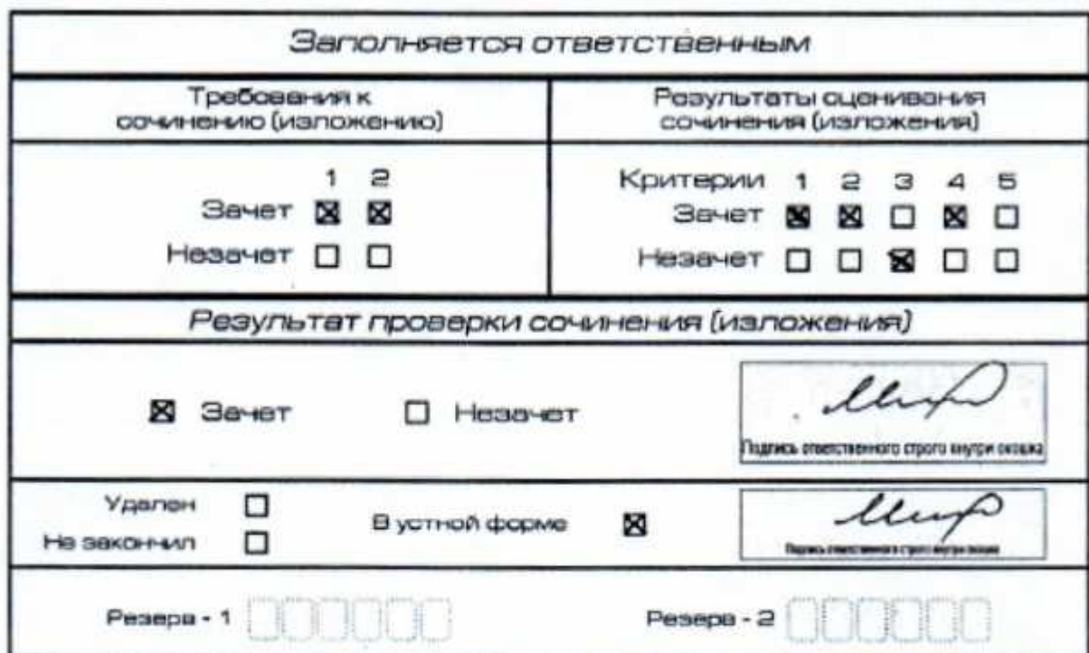
Рис. 12. Область для оценки работы сочинения (изложения) в устной форме

После окончания заполнения бланка регистрации ответственное лицо ставит свою подпись в специально отведенном для этого поле.